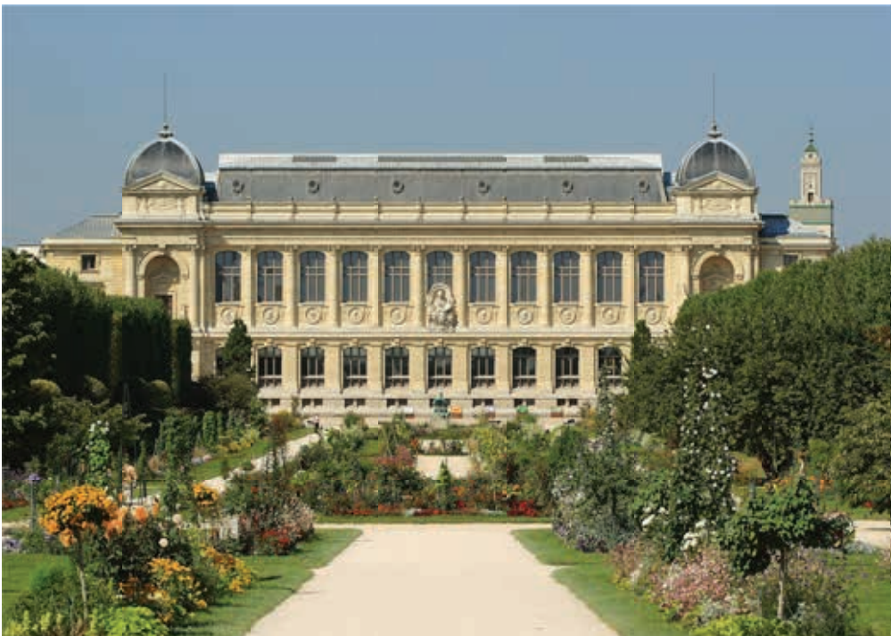
Maxence Peigné Félix Clémenceau

Les premiers terrains sont achetés le 21 février 1633.